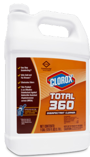
4/3.78L Artnr 31650