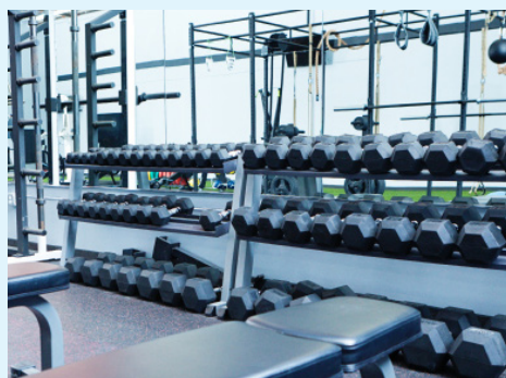
Gym Beskytter utøvere der de trener

MRSA, VRE og ESBL er bakterier som enkelt overføres der hvor mange mennesker deler treningsutstyr