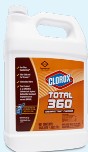
4/3.78L Artnr 31650